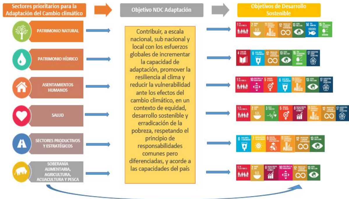
1. CONEXIÓN DE LA NDC – COMPONENTE ADAPTACIÓN CON LOS OBJETIVOS DE DESARROLLO SOSTENIBLE (ODS)